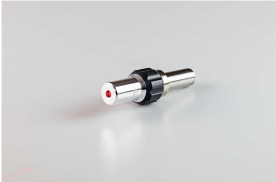
Tschorn Lasertaster zum groben Positionieren von Werkstücken.