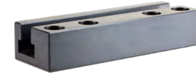
Quer-Nutenleiste Art.Nr. 003S00Z40